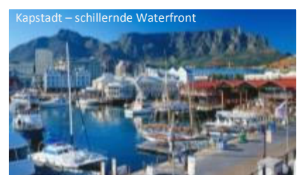
Kapstadt – schillernde Waterfront

Diese Ausflüge werden von Rodney vor Ort organisiert und können auch dann bezahlt werden.