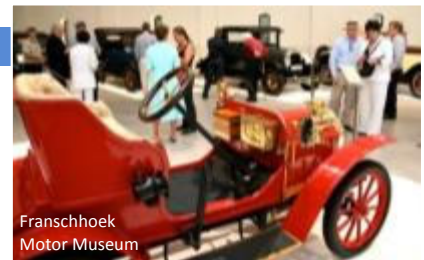
Franschhoek Motor Museum