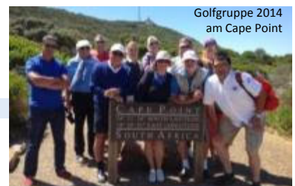
Golfgruppe 2014 am Cape Point