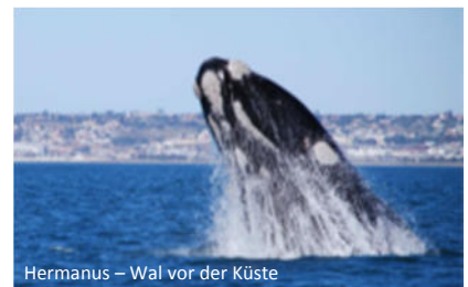
Hermanus – Wal vor der Küste